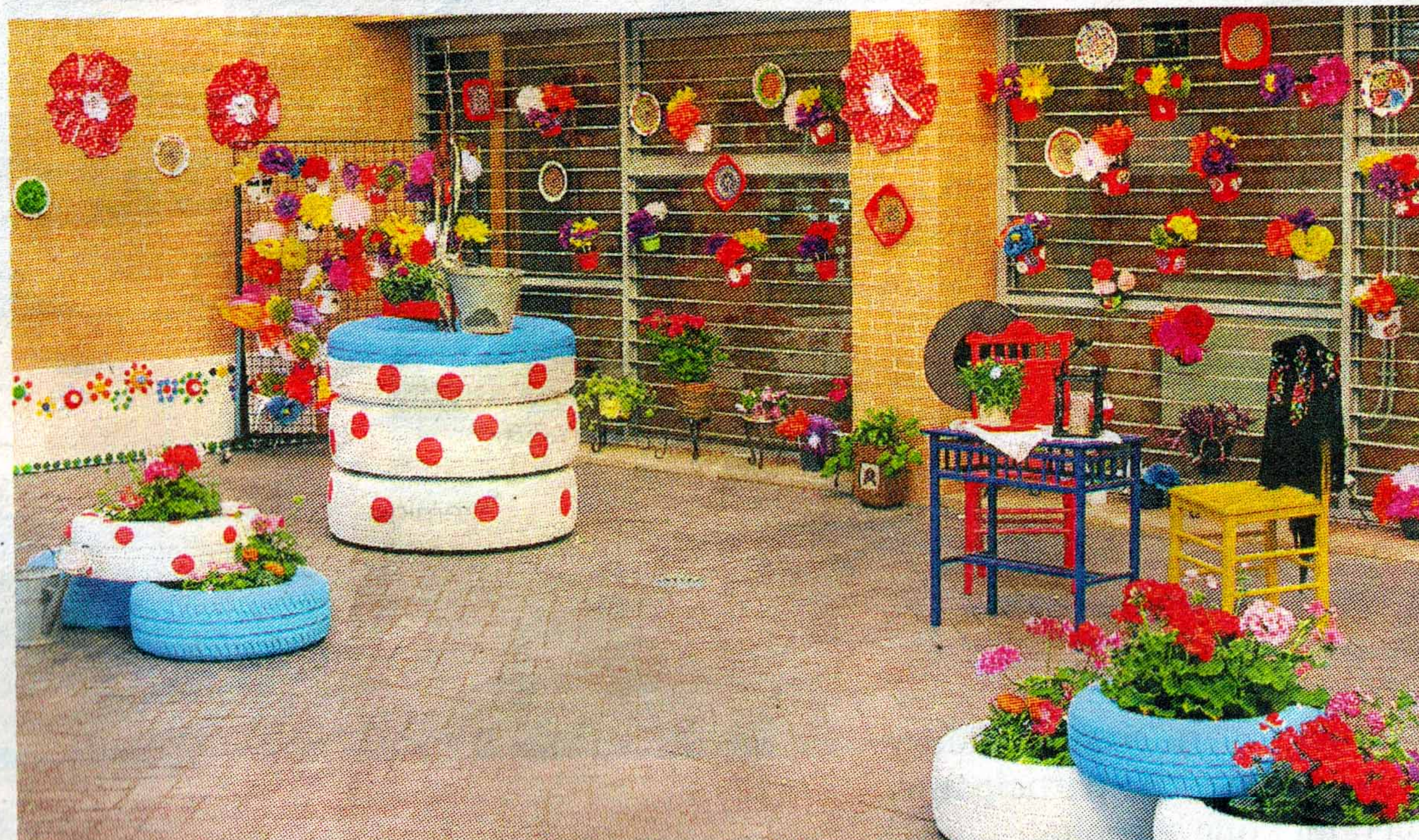
DETALLE DE LA DECORACIÓN DEL PATIO, PREMIO DEL AYUNTAMIENTO DE CÓRDOBA.