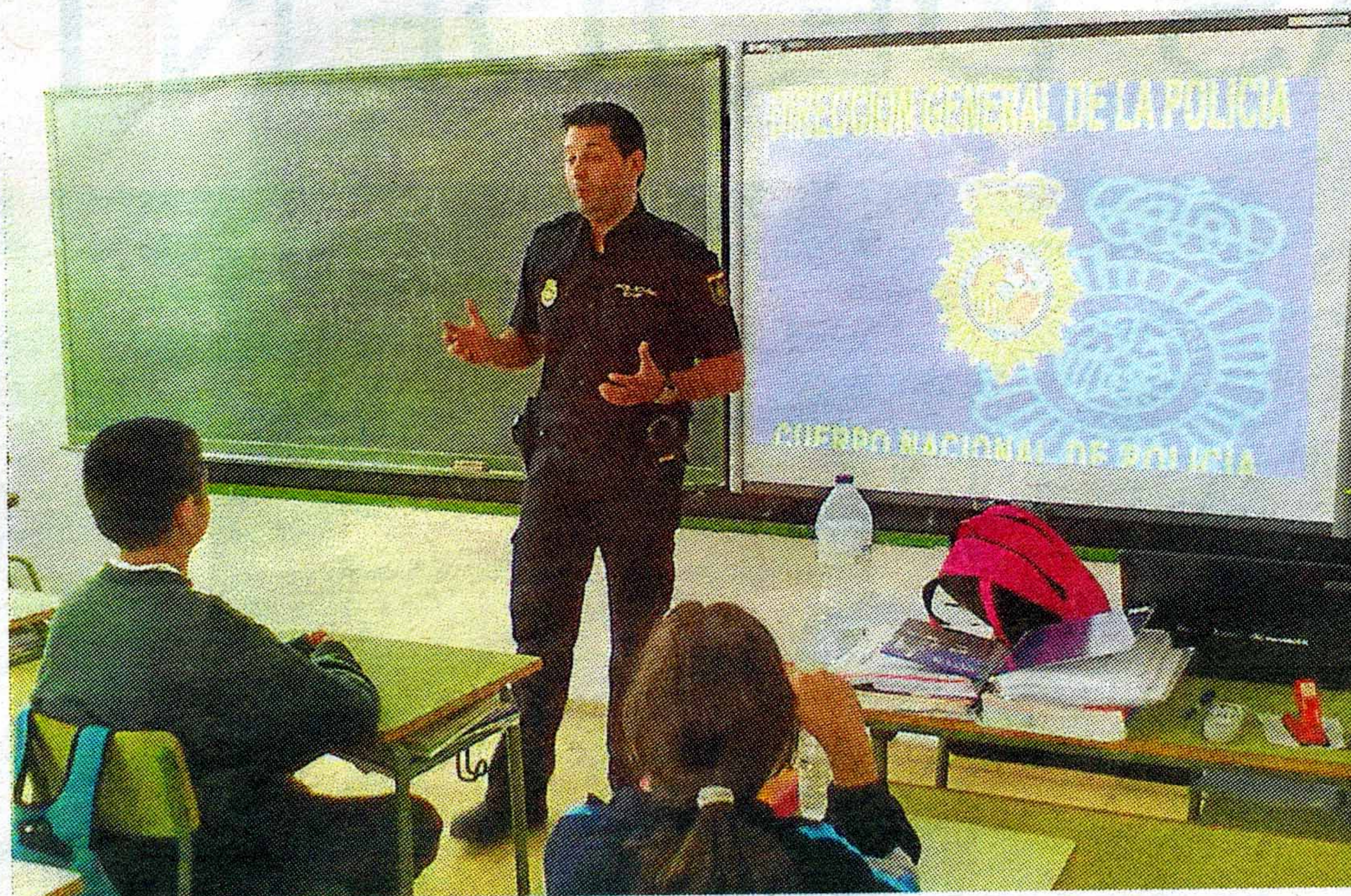
ALUMNOS DEL IES ZOCO ASISTEN A UNA CHARLA DE LA POLICÍA NACIONAL EN EL CENTRO.

Velar por la seguridad presente y futura de nuestros alumnos y alumnas, previniéndonos de aquellos riesgos que puedan presentarse en su vida, es una apuesta importante en nuestro centro y por eso trabajamos día a día en este sentido.